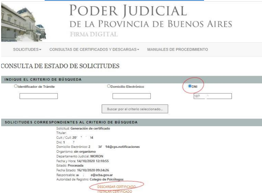
Imagen 6. Descarga del certificado personal con los mismos pasos que el certificado raíz.